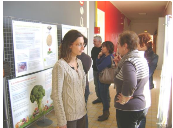
Journée échanges et formation dans le cadre de l'« Agenda 21 des Collèges de l'Aude ».

Nous avons contribué à la journée « alimentation durable » une introduction aux outils pédagogiques disponibles et présenté une sélection des activités possibles sur cette thématique.