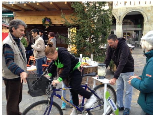
Le vélo à smoothies

Eco-citoyennetés a répondu présente à l'appel à participation de Gée Aude pour proposer un programme d'animations destinées aux habitants du Quartier Aude de Limoux. Les activités proposées ayant été retenues par les collectivités concernées, nous avons contribué à trois villages thématiques – sur les thèmes de l'alimentation, la consommation et l'énergie, et avons réalisé une animation « Manger bien pour trois fois rien ». Les villages thématiques ont été particulièrement bien accueillis par les enfants du Quartier Aude.