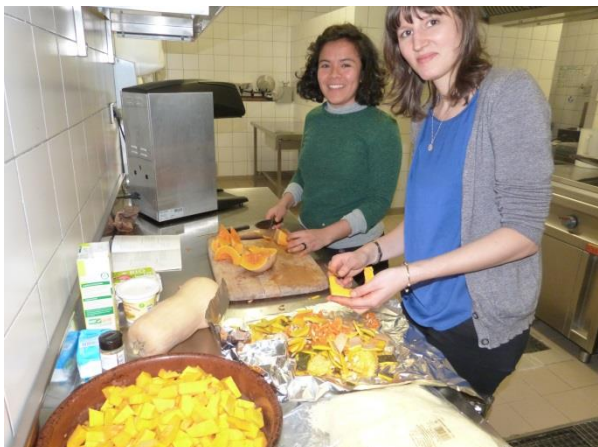
Atelier de cuisine de saison